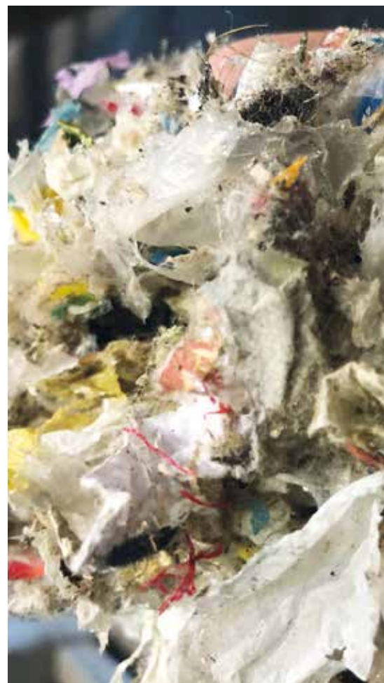
Und darum geht es: Das ist der Ersatzbrennstoff, um den sich alles dreht.

Brandschutztechnik ist die Ersatzbrennstoffaufbereitung schon eine gewaltige Herausforderung: Dies beginnt bei den hochkalorischen Inputstoffen mit der notwendigen Vorzerkleinerung und der Separierung möglicher Fremd- und Störstoffe, der dann folgenden Homogenisierung und endet nach dem Weitertransport in den Materialfertiglagerern der ELM. Diese unterschiedlichen Prozessschritte müssen brandschutztechnisch im Sinne der Vorbeugung erfasst und kontrolliert werden, ganz unabhängig davon, dass natürlich auch entsprechende Löscheinrichtungen zur Verfügung stehen müssen. „Das ist allerdings nicht unser Part“, wie Andreas